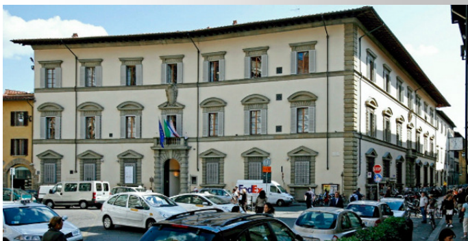
Palazzo Guadagni Strozzi Sacratì